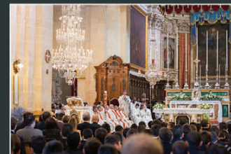
Quddies ta' Radd il-Ħajr 'l Alla fil-Katidral