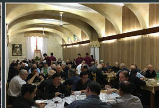
Pranzu għas-sacerdoti fis-Seminarju