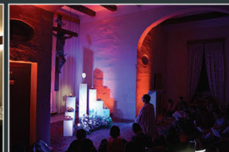
Adorazzjoni fil-kamerata tas-seminaristi