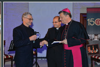
Tnedija uffiċjali tal-ktieb The Sacred Heart Seminary - The Heart of Gozo waqt il-kunċert Sur Sum Corda