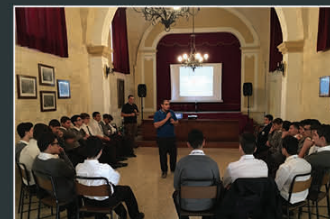
Zjajar tal-istudenti tas-sekondarja