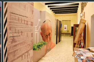
Wirja 150 sena Seminarju